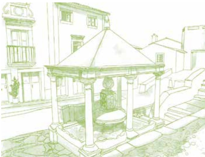
Fonte da Vila. O ex-libris de Castelo de Vide datará do reinado de D. João III.

O numeroso conjunto das fontes de Castelo de Vide e da sua envolvente evidencia a riqueza em recursos hídricos desta localidade. Iniciando-se junto ao cemitério, o percurso desenvolve-se pelos espaços mais movimentados da vila permitindo percorrer alguns dos seus espaços mais nobres e descobrir alguns dos seus recantos. Aqui se encontram as fontes mais monumentais e de maior valor artístico. Segue depois pela zona periurbana mais baixa acompanhando a Ribeira de São João, envolto por terrenos agrícolas de quintas e quintais. Neste troço percebemos que as fontes foram locais que serviam simultaneamente para abastecimento humano, para dar de beber aos gados e também para lavar a roupa. Delas se encaminha água para rega e, no final, a que sobra, sempre encontra o curso de água mais próximo. O percurso contorna Castelo de Vide seguindo por veredas estreitas e muradas e por uma calçada medieval, já quando se dirige novamente para a vila, onde entra no seu núcleo mais antigo por uma das antigas portas da muralha - a Porta de São Pedro - e cruza a rua principal da cidadela muralhada, a Rua Direita. Cruza novamente a muralha saindo pela Porta da Vila e continua de fonte em fonte pela zona da antiga judiaria. O percurso culmina na Fonte da Vila, mas termina percorrendo alguns dos espaços mais nobres da vila.