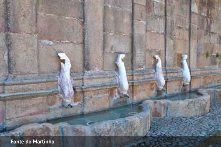
Fonte do Martinho